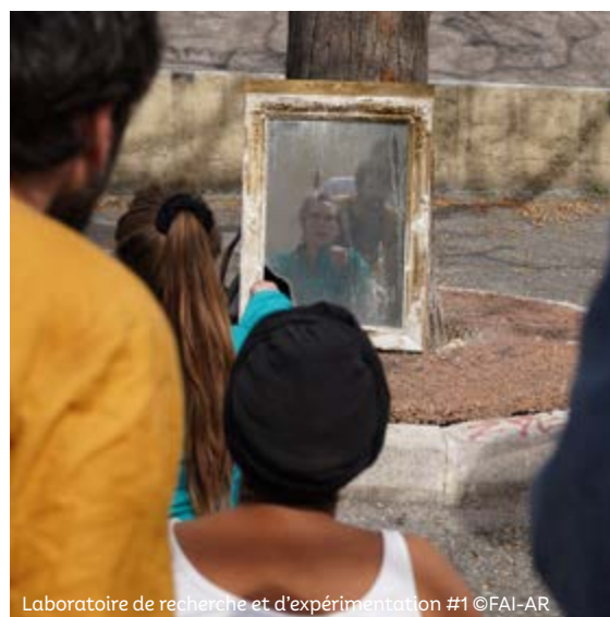
Laboratoire de recherche et d'expérimentation #1