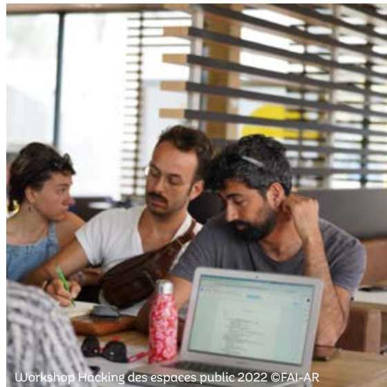
Workshop Hacking des espaces public 2022

Les temps de résidence sont des temps de formation où les apprenti·e·s sont en autonomie sur la recherche de lieux d'accueil et la mise en œuvre de leurs accueils dans ces lieux. C'est l'occasion de travailler à sa recherche artistique en condition professionnelle dans le réseau culturel du territoire national.