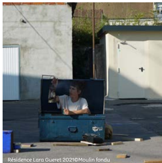
Résidence Lara Gueret 2021©Moulin fondu